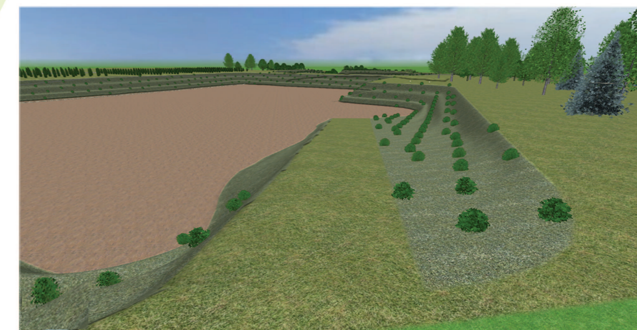
Vista 5 - Dalla rampa di accesso lato sud area 18