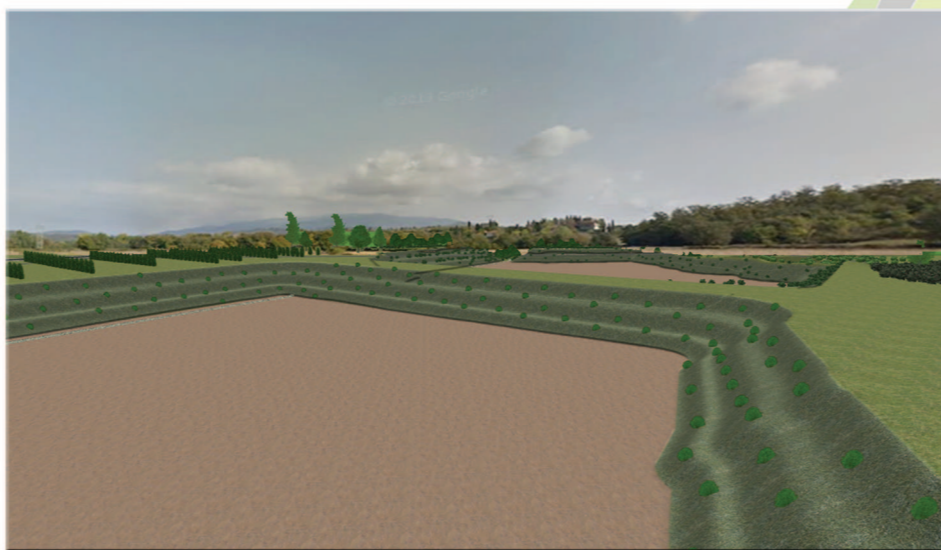
Vista 7 - Da area lato sud verso strosce