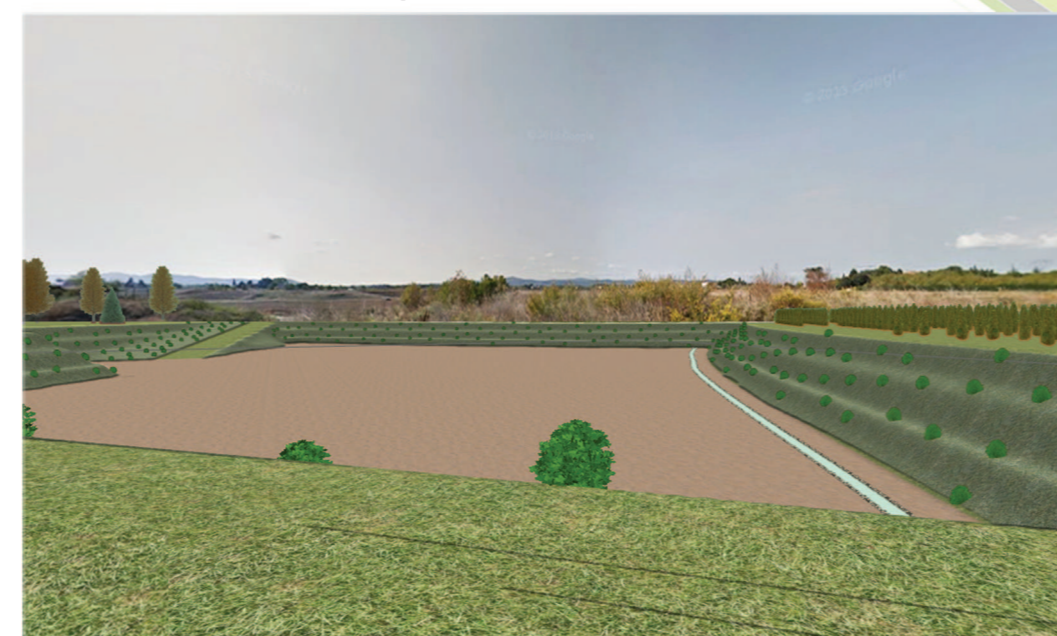
Vista 6 - Dall'Acquedotto verso area 22